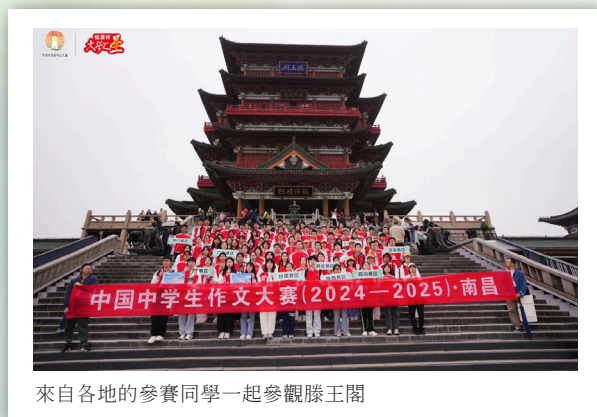
來自各地的參賽同學一起參觀滕王閣