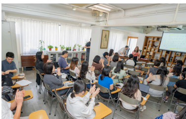
教師寫作工作坊在香港中華文化促進中心舉行。