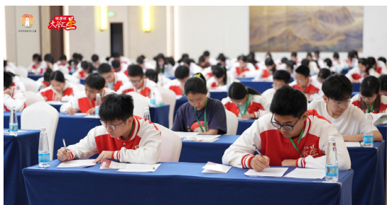
總決賽舉行筆試的會場